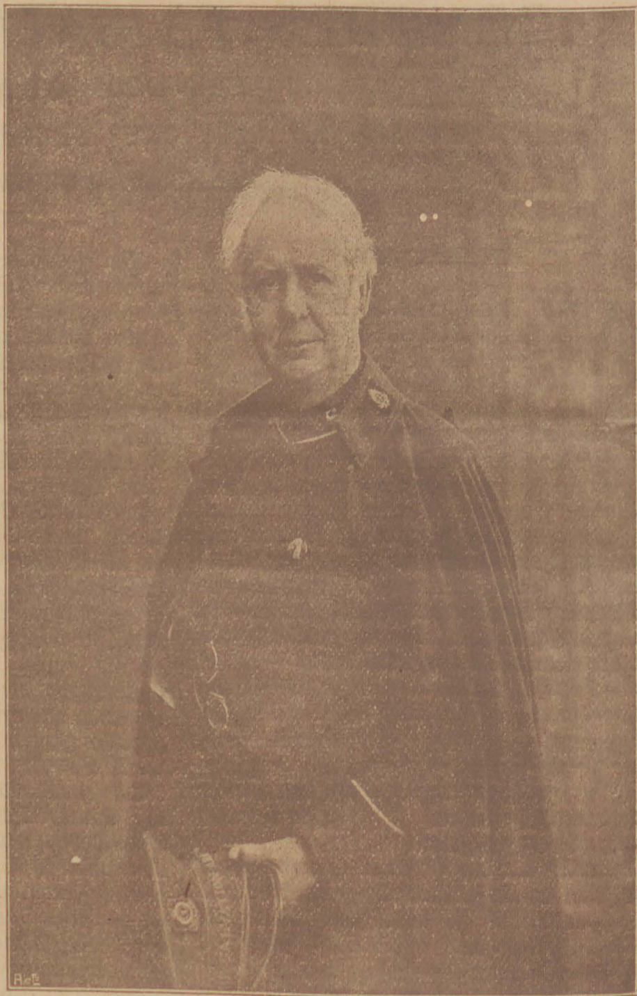
GENERAAL BRAMWELL BOOTH.